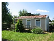
Mobil-home PMR 2 chambres 35 m 2 - 4 pers

2 chambres avec chacune un lit 2 pers 2 chambres avec chacune 2 lits 1 pers Cuisine équipée - salon avec canapé - TV 2 Salle d'eau (douche ; lavabo) - WC séparé Terrasse couverte avec salon de jardin - fauteuil relax et barbecue